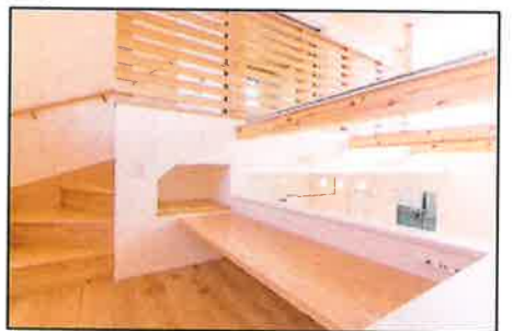
階段の踊り場を利用したステイールームです。