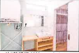
ガス乾燥機が付いています。