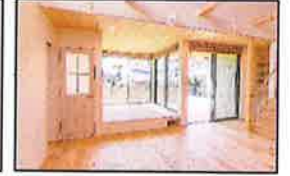
1階小上り畳にも床暖があります。