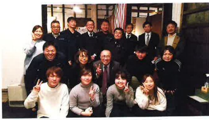
終了後、社員だけの記念撮影♪

定期通りに始まり、予定通りキック12時間で終わりました。 コロナ対策を意識したゲームは拍手で盛り上がり、今までにない楽しいコミュニケーションの取り方で良い経験となりました。(くぼやま)