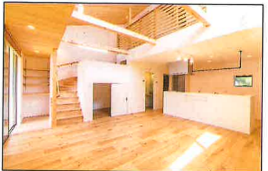
1階リビング キッチンが2階廊下から見下ろせる吹抜けです。