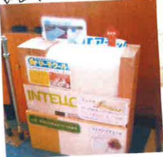
設置した壁の模型

12月13日、14日で構造見学会を 行いました。クリスマスが「近かった」ので クリスマスツリーを飾りつけました。 たくさんの方に、SE構法を見て頂きました。