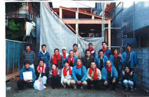
11/19 上棟後、大工さんと一緒に記念撮影

今日の現場見学会では、完成してからは見る ことのできない、柱などの構造部分をご 見学できますので、是非、お気軽にお立ち 寄りください。SE構法の専門家も来られます!