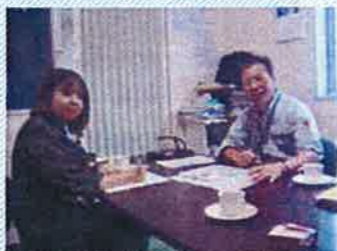
▲インタビューの様子