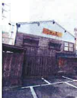
海鮮居酒屋 竹乃屋 東比恵店