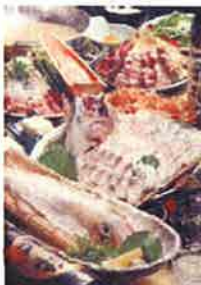
呼子直送! ヤリイカ活造り (計量)1600円~

透き通る刺身を食べた後は、天ぷら、塩焼き、ゲソ刺で余すところなくお食べ頂けます。