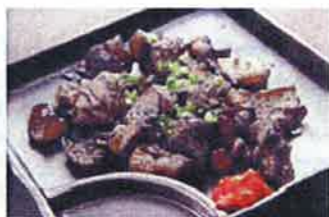
赤鶏のもも焼き 790円(税込829円)

透き通る刺身を食べた後は、天ぷら、塩焼き、ゲソ刺で余すところなくお食べ頂けます。