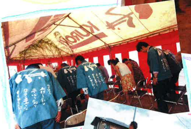
四方清め祈いの儀。