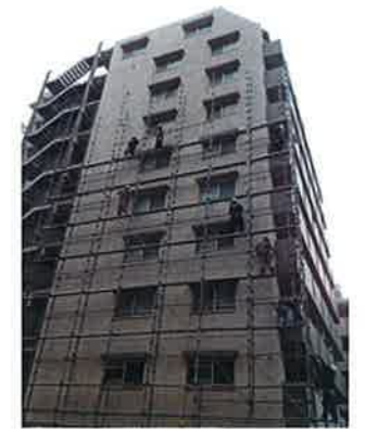
タツマ産業(株)足場組立中