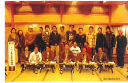
タツマ産業(株)正月の社内旅