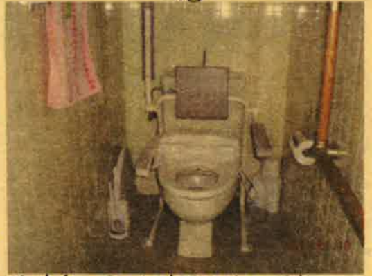
※トイレのアームスト取り付け写真 通常のトイレにするのと違って写真。

実は、黒木建設さんの住まい・RU・クラブという仕組みに介護サポート工事ができるサービスがあるなんて知りませんでした。今回たまたまこのサービスを知り、受けることができ、ラッキーでした。今回の工事で一番良かったことは寝室にエアコンがつけたこと。今までは、冬の寒いときに、夜中に何度も起きて介護していました。介護中、本当に寒いと感じていました。今ではエアコンのおかげで、介護する方もされる方もとても快適です。あとは廊下に手摺がついたことも非常に便利。今まではトイレに行くにも膝座って移動していましたが、手摺のおかげで立ってゆくり歩いて移動しています。トイレの行き帰りが自然とリハビリになっているんです。介護保険では適応されない工事(エアコン工事等)も住まいRUクラブでできるという点は、とても魅力だと思います。