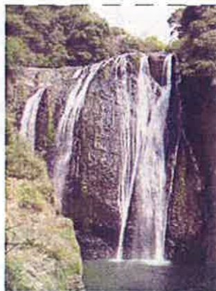
日本の滝100選に選ばれた龍門滝