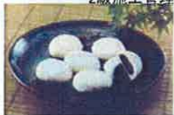
かじき饅頭 起源はおおよそ400年前。工事現場のお茶うけで出されたことから言われている。